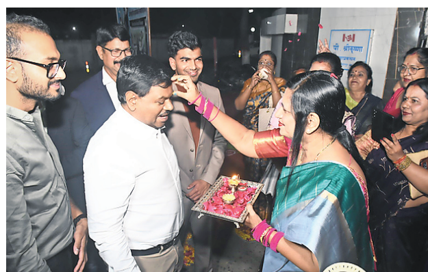
तिलक लगाकर स्वागत करते हुए जीएम की धर्मपत्नी।