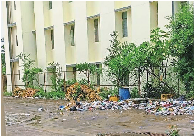
मेडिकल कालेज के आवासीय परिसर में इस तरह से पसरा कचरे का ढेर।

न सिर्फ डाक्टर आवास बल्कि पूरे परिसर में कचरा : मेडिकल कालेज सोहागपुर जनपद पंचायत अंतर्गत ग्राम पंचायत चांपा में आता है जहां पर संभाग एवं आसपास के अन्य जिले से लोग इलाज कराने के लिए पहुंचते हैं। मेडिकल कालेज जहां