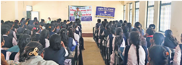
कन्या महाविद्यालय में जागरूकता कार्यक्रम में बोलते विधिक अधिकारी।